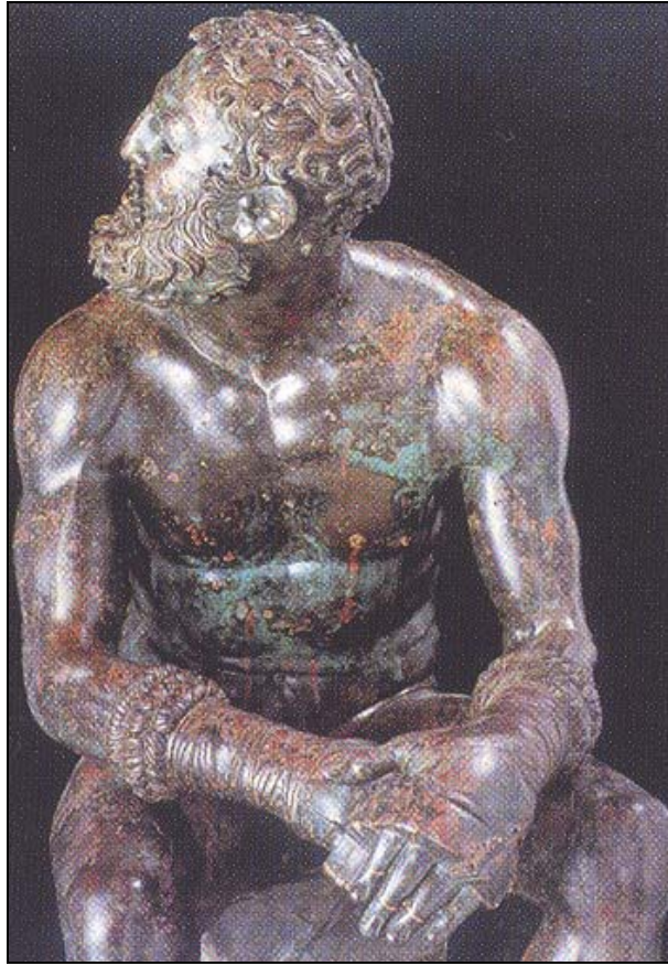
Détails d'himantes dures, Bronze, Rome.