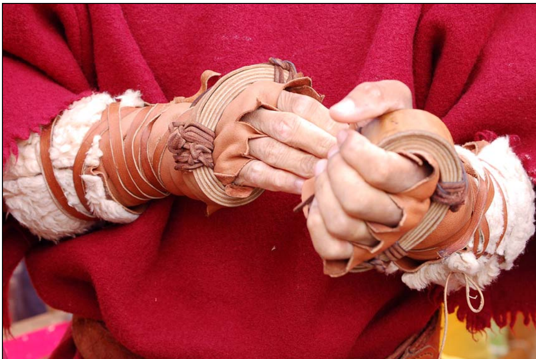
Détails d'himantes dures reconstituées