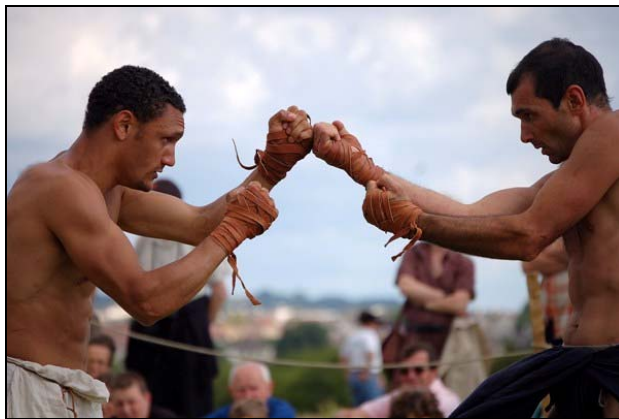
Affrontement de pugilat avec les cestes

Les Crétois la pratiquent 2500 à 2000 ans avant notre ère, puis les Grecs en 2000 av. J.-C., et enfin les Etrusques, aux alentours de 1300 avant. Elle devient discipline Olympique en 688 avant notre ère, au cours de la 23 ème Olympiade, où Onomastos de Smyrne en fut, d'après Philostrate, le vainqueur. Les Romains se l'approprient en 366 av. J.-C. Des évolutions s'opèrent selon ses diverses localisations. Nous allons ici nous intéresser plus précisément au pugilat , qui s'est développé entre le VI ème siècle avant et le IV ème siècle après dans les Jeux Olympiques.